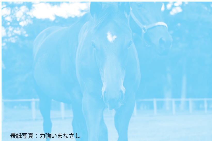
表紙写真：力強いまなざし